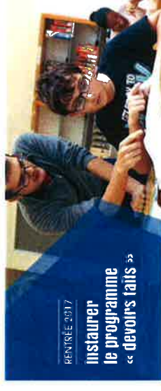
RENTREE 2017 Installer le programme « devoirs faits »

Année scolaire 2017-2018 académie de Bordeaux : contingent de 1 180 volontaires du service civique. Ceux qui exerceront leurs missions en collège contribueront au programme « devoirs faits » en collaboration avec les référents du dispositif.